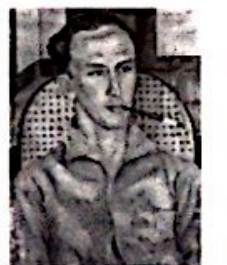
Rastros urbanos XIII , 1985 prova colorida colada sobre aglomerado, 30 x 39,4 cm Doação artista, 1987